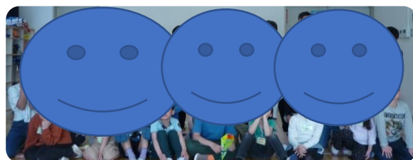
～4月生まれお祝い会～